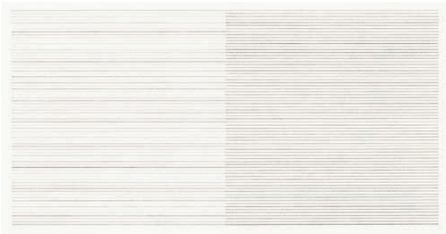
Gru V - 7.6.2008