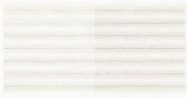
Gru III - 3.5.2008